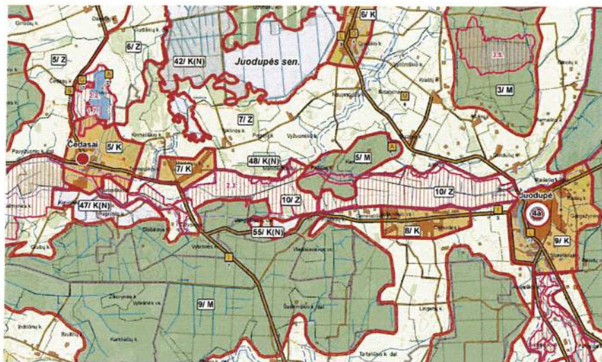
3.1.1. pav. Rokiškio rajono savivaldybės teritorijos bendrasis planas, Žemės naudojimo, tvarkymo ir apsaugos reglamentų brėžinys.

Planuojamoje teritorijoje galioja Rokiškio rajono savivaldybės teritorijos bendrojo plano sprendiniai (3.1.1. pav.).