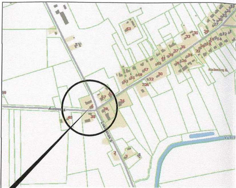
Planuojamos teritorijos situacijos schema (www.regia.lt)