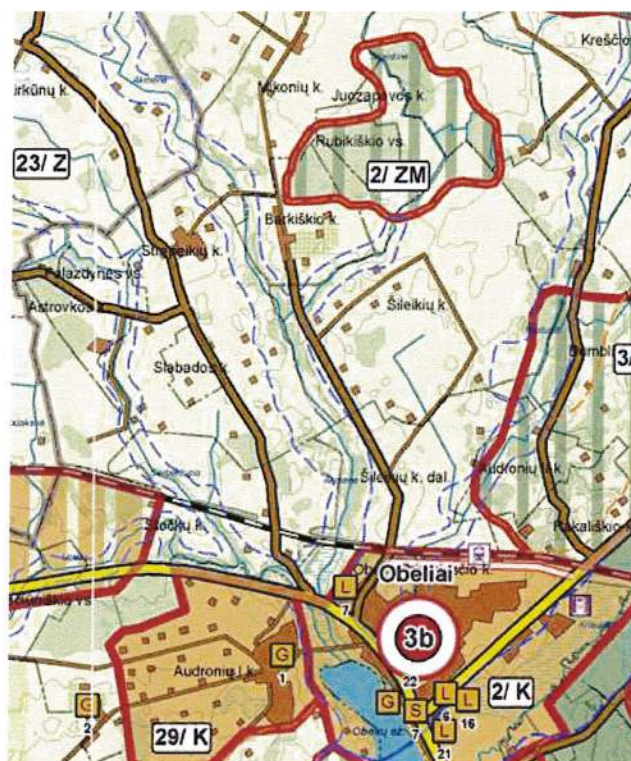
3.1.1. pav. Rokiškio rajono savivaldybės teritorijos bendrasis planas, Žemės naudojimo, tvarkymo ir apsaugos reglamentų brėžinys.

Planuojamoje teritorijoje galioja Rokiškio rajono savivaldybės teritorijos bendrojo plano sprendiniai (3.1.1. pav.). Formuojamas žemės sklypas esamiems pastatams Šilaikių g. 24, Barkiščio k., Obelių sen., Rokiškio r. sav., šalia rajoninio kelio Nr. 3630, iki Obelių miesto apie 5 km.